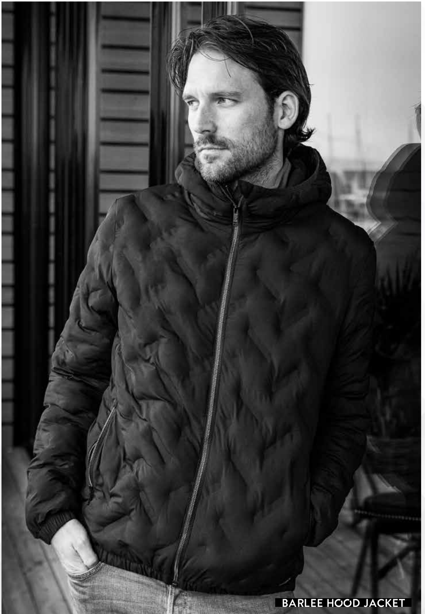
BARLEE HOOD JACKET