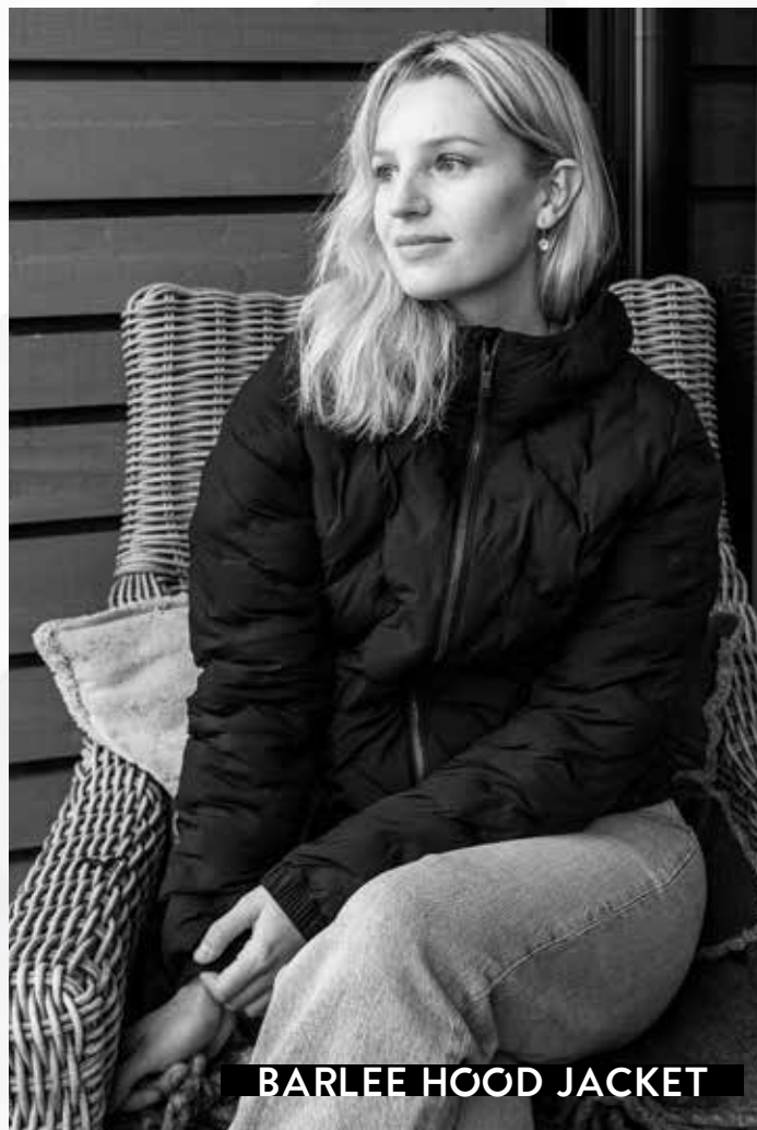
BARLEE HOOD JACKET