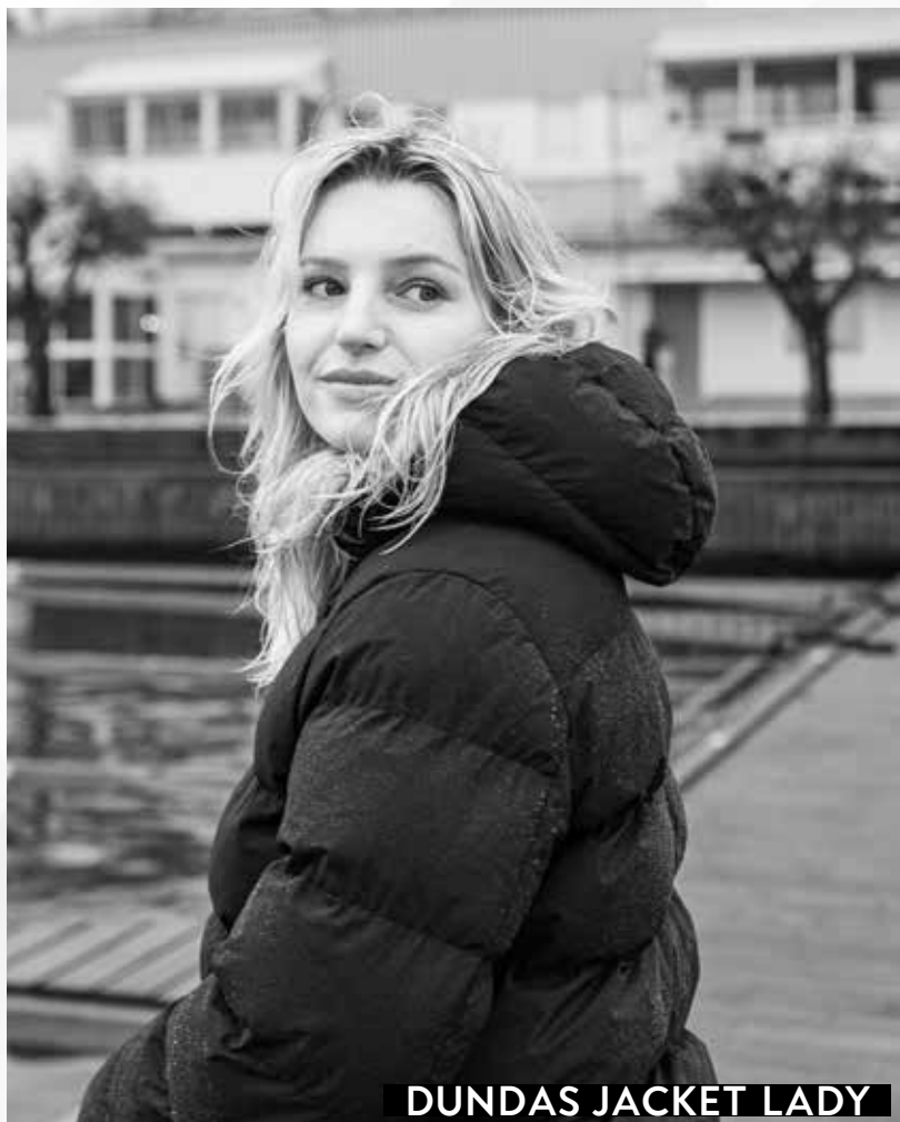
DUNDAS JACKET LADY