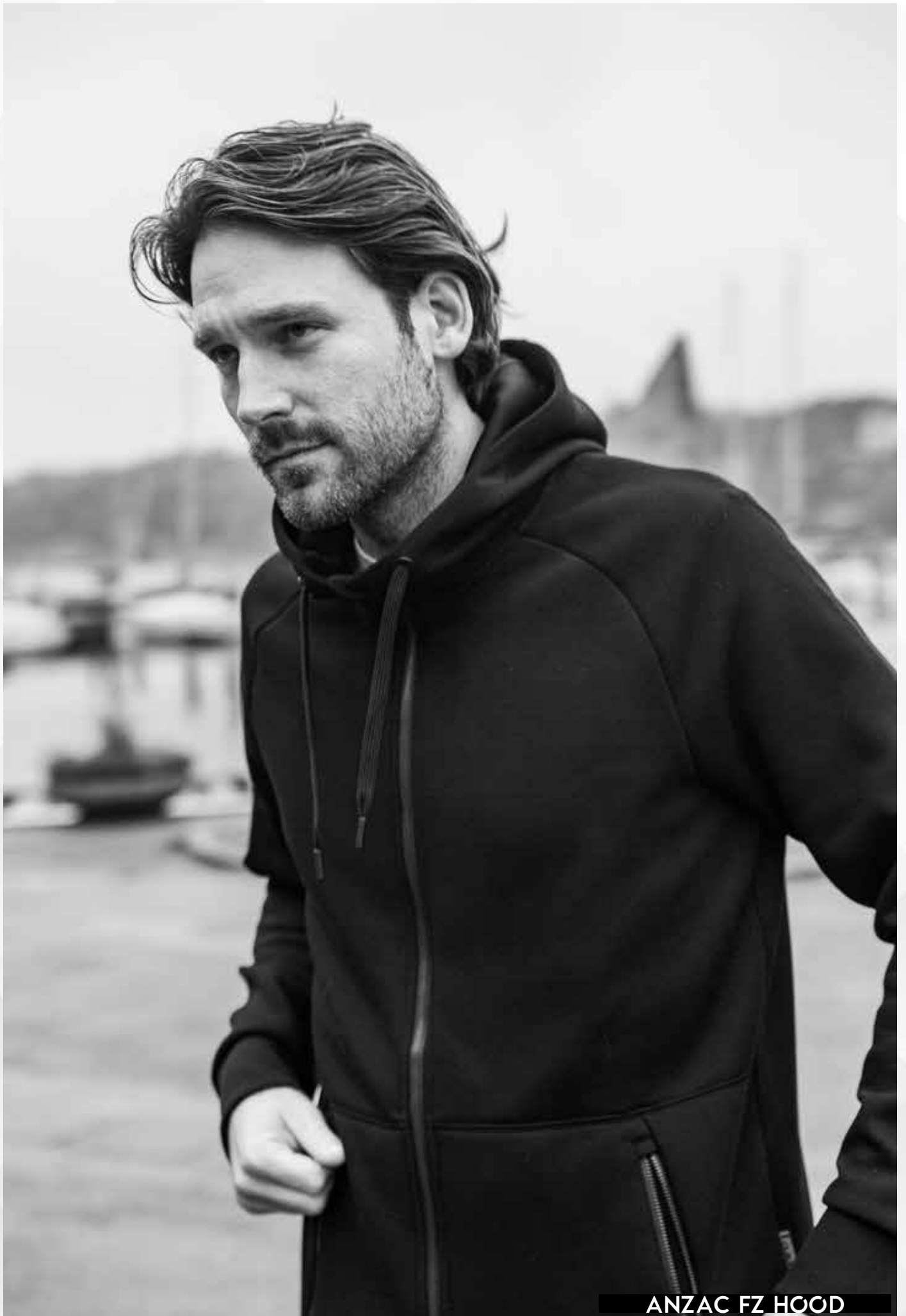
ANZAC FZ HOOD